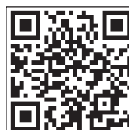
推薦書・経歴書はこちらから